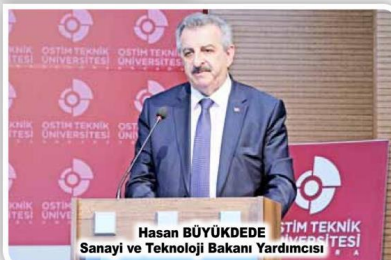
Hasan BÜYÜKDEDE Sanayi ve Teknoloji Bakanı Yardımcısı