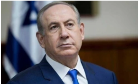
Netanyahu, Ateşkes Şartını Açıkladı