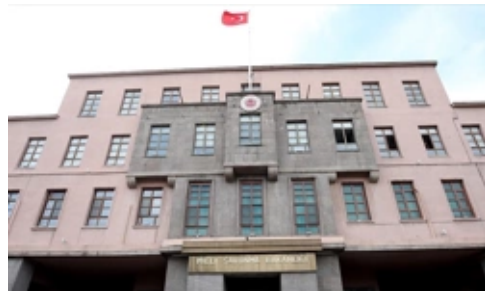
MSB Paylaştı, 12 Terör Hedefi Yerle Bir Oldu