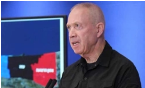
İsrail, Gazze'nin Merkezine Girdi mi?