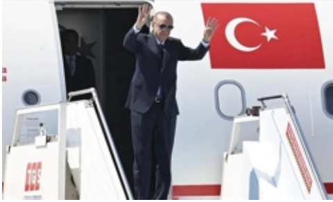
Cumhurbaşkanı Erdoğan, Özbekistan Yolcusu