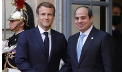
Sisi ve Macron'un Gündeminde de Gazze Vardı