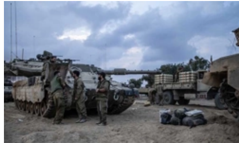
ABD'den İsrail'e Ters Köşe