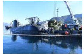
Düşmanın Dümen Suyuna Girer Ama Sadece Yok Etmek İçin!