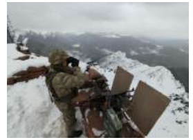
Pençe Serisi Operasyonlar Sayesinde Irak'tan Türkiye'ye Yönelik Saldırlar Engelleniyor