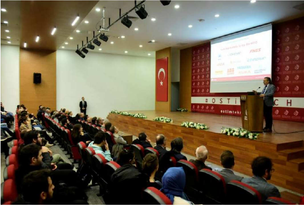
"Marka Ders" Nedir?

3'üncü Nesil eğitim anlayışıyla yola koyulan OSTİM Teknik Üniversitesinin en özgün ve yenilikçi kavramlarından biri olan Marka Dersler, nitelikli insan kaynağı yetiştirmek amacıyla sektörlerinin öncü firmaları tarafından; kendi alan, ürün, hizmet ve uygulama konularını güncel bilgilerle donatarak öğrencilere aktardıkları, OSTİM Teknik Üniversitesi müfredatlarında firmaların kendi markalarıyla açtıkları dersler.