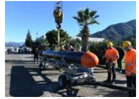
Harp Başlıklı AKYA Torpido Hedefi Kaçırmadı