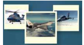
Savunma Sanayii İmalatçılar Derneği SASAD 34 Yaşında