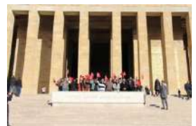
Uluslararası Öğrenci Grubunun Atatürk İlgisi