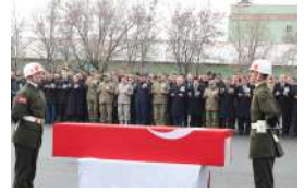
MSB: Hiçbir Şehit Yakını Şehadet Haberi Sosyal Medyadan Öğrenmemelidir