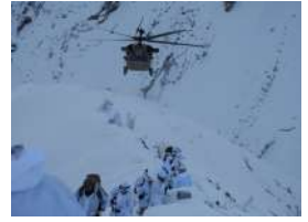
Irak'ın Kuzeyinde Şehitler Verilen Çatışmalarda Neler Yaşandı?